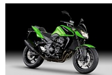
Candy Lime Green

Alle Preise verstehen sich als netto inkl. 8% MWST exkl. Ablieferungspauschale.