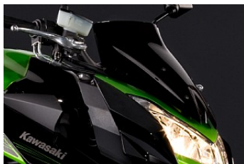
WINDSCHUTZSCHEIBE CHF 143.65