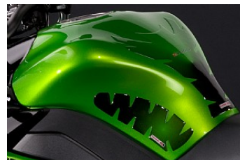
TANK-PAD EINSCHLIESSLICH SCHLÜSSELANÄNGER-SCHUTZ Z CHF 66.20