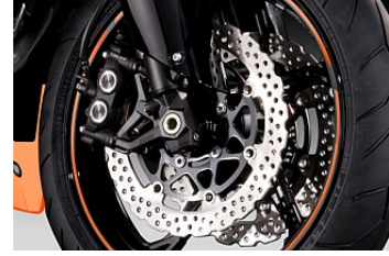
Bremsen mit ABS