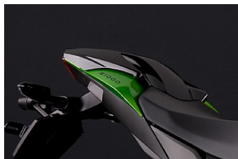
ABDECKUNG FÜR SOZIUSSITZ Preis ab CHF 289.00