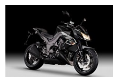
Metallic Spark Black