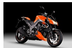
Candy Burnt Orange / Metallic Spark Black

Das Design der Z1000 ist von Anfang an eigenständig und hebt ihre kraftvolle Schönheit hervor. Zukunftsweisendes Styling gepaart mit Supersport Handling, Bremsen und einem nur für Naked Bikes kreierten Motor in einem atemberaubenden Paket - das ist Kawasakis Z1000, ein Super-Naked-Bike.