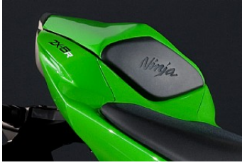
ABDECKUNG FÜR SOZIUSSITZ CHF 219.85