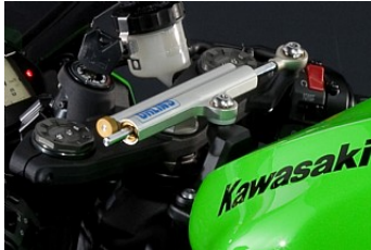
Lenkungsdämpfer in Rennqualität