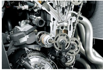
Höhere Leistung im mittleren Drehzahlbereich